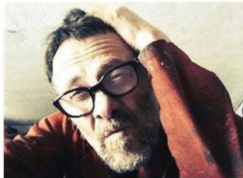
L'attore Francesco Campanoni leggerà dal vivo alcune poesie nella serata dell'8 febbraio

hou Cina 2015; «Where Water Comes Together With Other Water», Spazio Futuro Anteriore, Varese 2017; «Segno e Colore», Ordine Architetti Varese, 2017. La mostra proseguirà sino al 22 marzo e sarà visitabile (previo contatto telefonico) tutti i giovedì dalle 16 alle 19 (o in altri orari da concordare secondo necessità). Il giorno 8